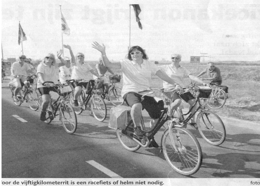
oor de vijftigkilometerrit is een racefiets of helm niet nodig.

Het was al dringen geblazen. De ingang, toch echt niet zo nauw want van twee kanten moeten er auto's doorkunnen, bleek het aanbod niet te kunnen verwerken. De eerste gesprekken vinden plaats tussen bekenden die in de rij staan om binnen te komen en geduldig op hun beurt wachten. Eenmaal binnen vind er een verdeling plaats. De 25 km. rijders, de 50 km rijders en de 100 km. rijders worden elk naar verschillende plaatsen gedirigeerd.